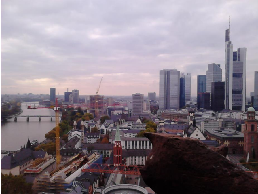
Vaade Frankfurdile DomTurmi tornist

Kokkuvõtte Event Presentationi teemalisest üle-Euroopalisest seminarist 25.-26. oktoobril Frankfurdis.